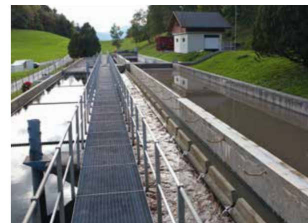
La STEP produit du biogaz qui est transformé en énergie.

La mobilité est un problème dans les régions de montagne mais les solutions existent. Parmi elles, Leysin met tous les jours à disposition de ses citoyens deux flexicards des CFF. Une manière de voyager à prix réduit. La Commune soutient aussi l'achat de vélos électriques par l'octroi de subventions. Si l'on ne peut pas se passer de la voiture, pourquoi ne pas conduire de façon écologique ? En ce sens, tout le personnel communal s'est vu offert des cours « ecodrive ». Leysin a également été une des premières communes à s'équiper d'une surfaceuse de glace fonctionnant au gaz naturel. Rouler au gaz naturel permet en effet de polluer deux fois moins et le litre équivalent essence est à 1 franc. La Commune est enfin l'une des rares qui turbine ses eaux usées. La STEP produit par ailleurs du biogaz qui est transformé, lui, en chaleur écologique. Une énergie utilisée pour chauffer les locaux et le digesteur. Les déchets verts partent à l'usine de biogaz de Roche