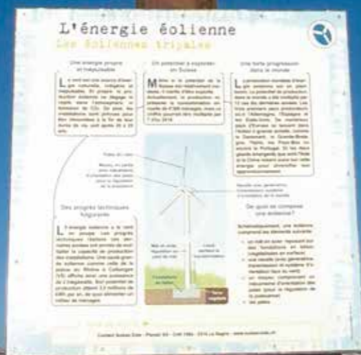
Le sentier didactique des énergies renouvelables, au départ du restaurant tournant Le Kuklos.

Leysin a obtenu en mars dernier le label Cité de l'énergie. Un label qui récompense 7 ans d'engagements de la part de la Municipalité et des employés communaux, dans des domaines aussi variés que les bâtiments, la mobilité ou les déchets.