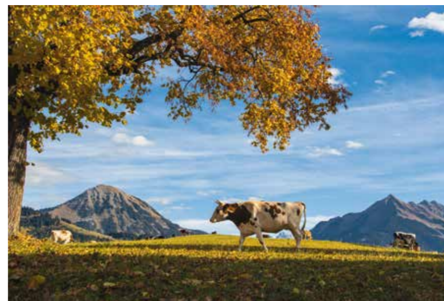
Une des cartes postales d'été de Leysin réalisée par Daniel Aebersold.

Retrouvez l'univers photographique de Daniel Aebersold sur www.aebersoldphoto.com