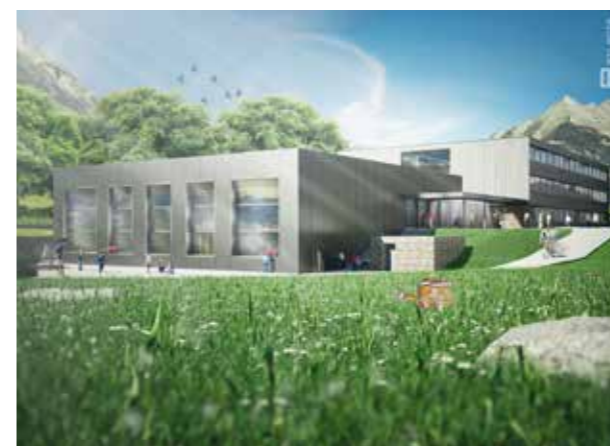
Projet du futur collège à énergie positive.

Assainir le parc immobilier c'est bien, mais construire juste est encore mieux. C'est en ce sens que la Municipalité a voulu réaliser le nouveau collège, pour que ce dernier soit à « énergie positive ». Cela signifie qu'il va produire plus d'énergie qu'il ne va en consommer. Les générations futures sont également au cœur de la réflexion de la Commune avec le sentier didactique des énergies renouvelables, au départ du restaurant tournant Le Kuklos. L'objectif : transmettre les meilleures informations aux jeunes venant de toutes les régions de Suisse et d'ailleurs. C'est toujours dans cet esprit que la Municipalité a non seulement rénové la petite