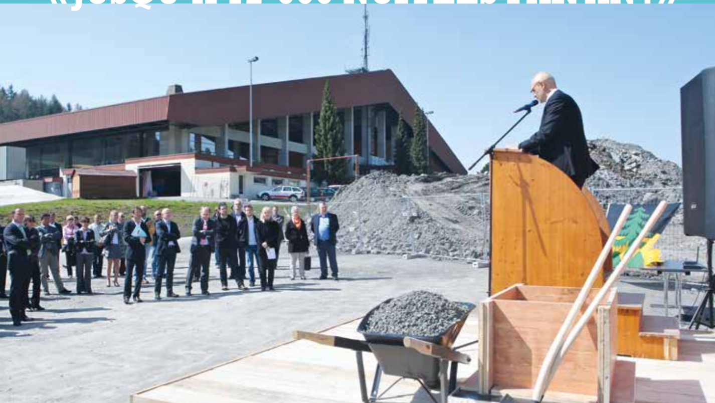
La Maison du Sport vaudois prendra place près du Centre Crettex-Jaquet.

Le projet de Maison du Sport vaudois entre dans sa phase concrète à Leysin. La pose de la première pierre a été célébrée le 2 mai dernier. L'ouverture des portes est annoncée au printemps 2015.